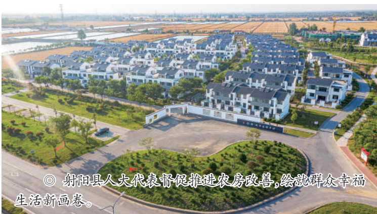
◎ 射阳县人大代表督促推进农房改善,绘就群众幸福生活新画卷。