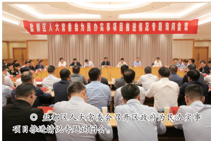
◎ 盐都区人大常委会召开区政府为民办实事项目推进情况专题询问会。

开展专题询问“点对点”。“请问住建局西河口启动区基础设施建设目前进展如何？”“请问交通局今年在进一步完善路网布局、实现交通内通外达方面有哪些重点工程安排？目前进度如何？”……关于长三角一体化产业发展基地基础设施建设专题询问会上，代表们围绕惠企政策落实、优化审批流程、强化服务保障等突出问题接连提问，被点到的部门主要负责人直面问题，逐一答题。区人大常委会同步做好专题询问“后半篇文章”，邀请委员、代表持续跟踪督办，常委会上听取审议意见落实情况报告并进行满意度测评。通过媒体报道将专题询问问答内容及整改承诺向社会公开，助推人大监督走进公众视野，扩大公众参与。