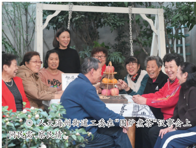
◎ 人大海州街道工委在“围炉煮茶”议事会上 问民需、察民情。

海州街道双龙社区以小街巷为主，每家每户门口都曾砌有花坛，随着时间流逝，加之疏于管理，有的杂草丛生，有的种满了菜，还有的黄土裸露。在一次“围炉煮茶”议事会上，有代表建议提升社区环境，做好塘巷花园街巷的全面整治提升。这一建议得到群众广泛认同，并纷纷结合实际提出自己的建议和需求。人大代表联合辖区工作人员、党员志愿者，共同制定了具体的整改方案，邀请绿化二处对塘巷的花坛进行修整、松土，购买了爬墙玫瑰、嫁接月季等植物进行栽种。在多方努力下，塘巷花园改造成功，整洁优雅，充满生机。为长期维护好塘巷花园的环境，代表们又在“围炉煮茶”议事会上出谋划策，组建了志愿小组定期进行浇水、修剪、施肥等工作，共同努力治理好、维护好群众的家园。