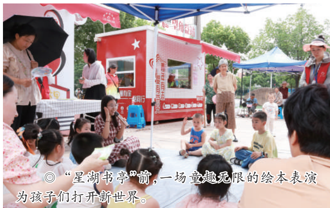
◎“星湖书亭”前，一场童趣无限的绘本表演为孩子们打开新世界。