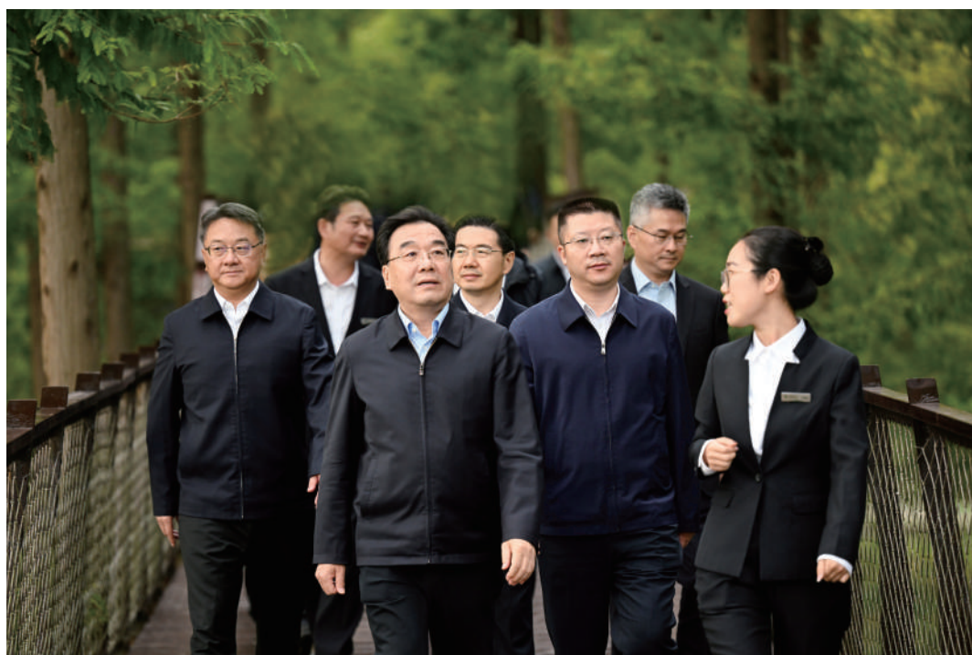
◆ 10月28日,省委书记、省人大常委会主任信长星到盐城市盐都区、东台市调研。