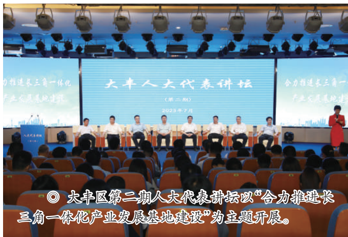
◎ 大丰区第二期人大代表讲坛以“合力推进长三角一体化产业发展基地建设”为主题开展。