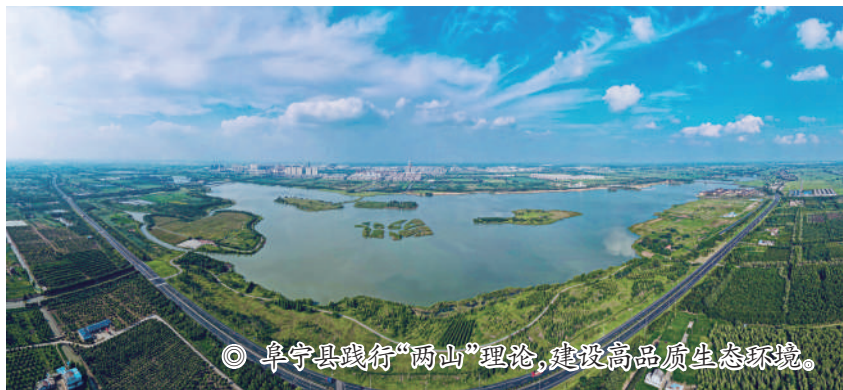
◎ 阜宁县践行“两山”理论,建设高品质生态环境。

报告工作全年化。 无论是大气、水、土壤等环境质量还是年度环保目标完成情况,关注整体环境质量,落实环境报告“年检”制度,成为阜宁人大的规定动作。年初公布主要指标当年目标值、每旬分类定向更新阶