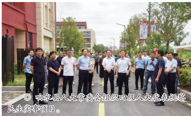
◎ 响水县委常委会组织四级人大代表视察民生实项目。

质不断提升……近年来,响水县委人大把推进民生实项目全过程监督与聚焦解决群众急难愁盼问题相结合,努力推动政府把一桩桩实事办到老百姓的心坎上。