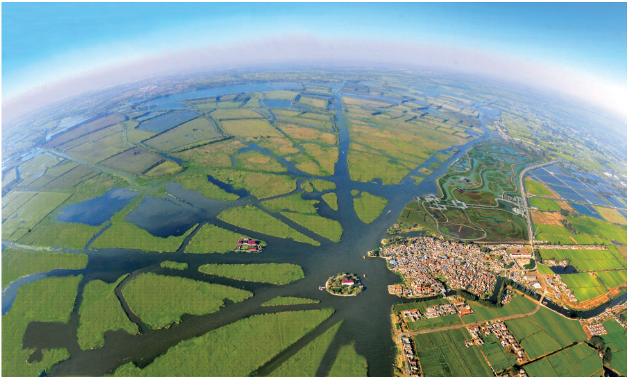
● 盐城九龙口淮剧小镇