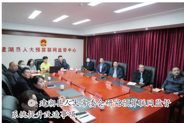
◎ 建湖县人大常委会研究预算联网监督系统提升改造事项。

聚焦监督全覆盖。围绕民生实项目监督,建立“1+15+N”(1个县级民生实项目监督中心、15个镇级民生实项目监督联络站、N个民生实项目监督联系点)的监督网络,通过“中心、站、点”相结合,构筑民生实项目监督矩阵,确保县级12件、镇级122件民生实项目全部纳入监管;围绕办好群众身边的“微实事”,建立与12345平台联动机制,畅通问题交办和信息互通