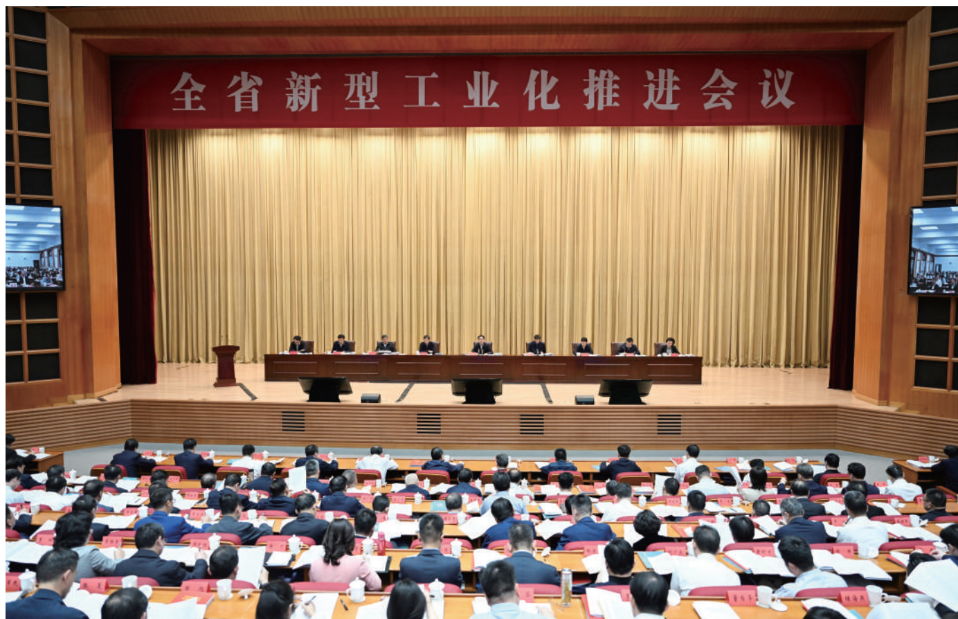
◆ 10月23日,全省新型工业化推进会议召开。省委书记、省人大常委会主任信长星出席会议并讲话。