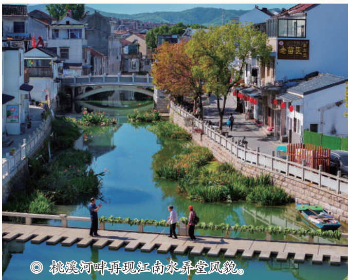
◎ 桃溪河畔再现江南水弄堂风貌。

长期以来，由于桃溪河沿线房屋密集、街巷狭窄，年久失修，加上设施配套不全，沿河污水排放，导致群众出行不便。2020年11月，市、镇两级人大代表到西街社区联系服务选民时，发现要求改造提升沿河环境、恢复古镇良好风貌的呼声很高。为此，张渚镇人大专门召集人大代表第四小组、居民一起走进人大代表联络站开座谈会。在充分听取群众意见的基础上，经镇十九届人大主席团会议讨论，达成了共识——必须尽快启动桃溪镇区段沿河改造，积极把桃溪河沿线打造成为张渚古镇的亮丽窗口，成为度假区全域旅游的示范板块。