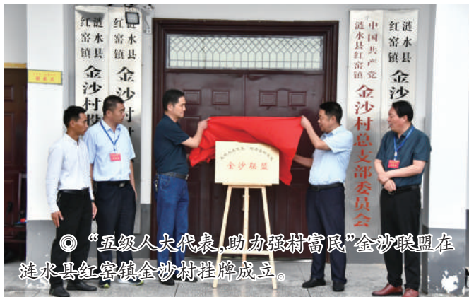
◎“五级人大代表，助力强村富民”金沙联盟在涟水县红窑镇金沙村挂牌成立。

委会组建了11个代表帮促联盟，开展“三亮三争”工作，即亮身份，深入一线、进村入户，争当依法履职的模范；亮项目，带头致富、带领致富，争当强村富民的模范；亮承诺，围绕中心、服务大局，争当助力发展的模范。