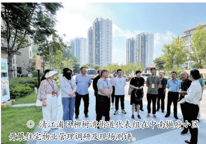
◎ 清江浦区柳树湾街道代表组在中南樾府小区开展住宅物业管理调研及现场测评。