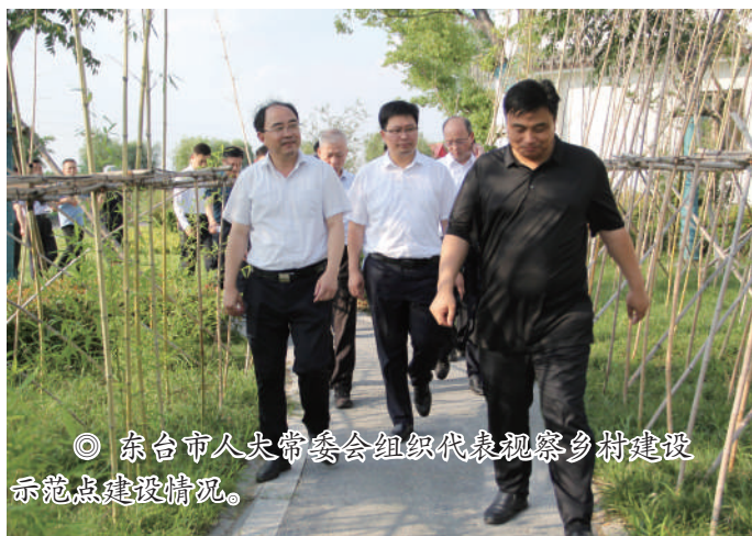
◎ 东台市人大常委会组织代表视察乡村建设示范点建设情况。