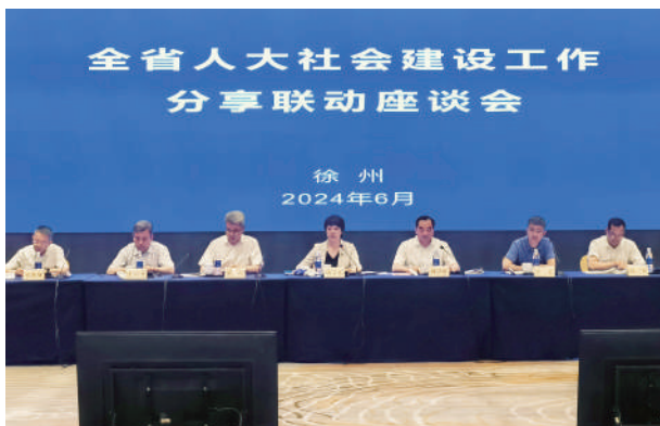
● 6月12日至13日,全省人大社会建设工作分享联动座谈会在徐州召开,省人大常委会副主任张宝娟出席会议并讲话。