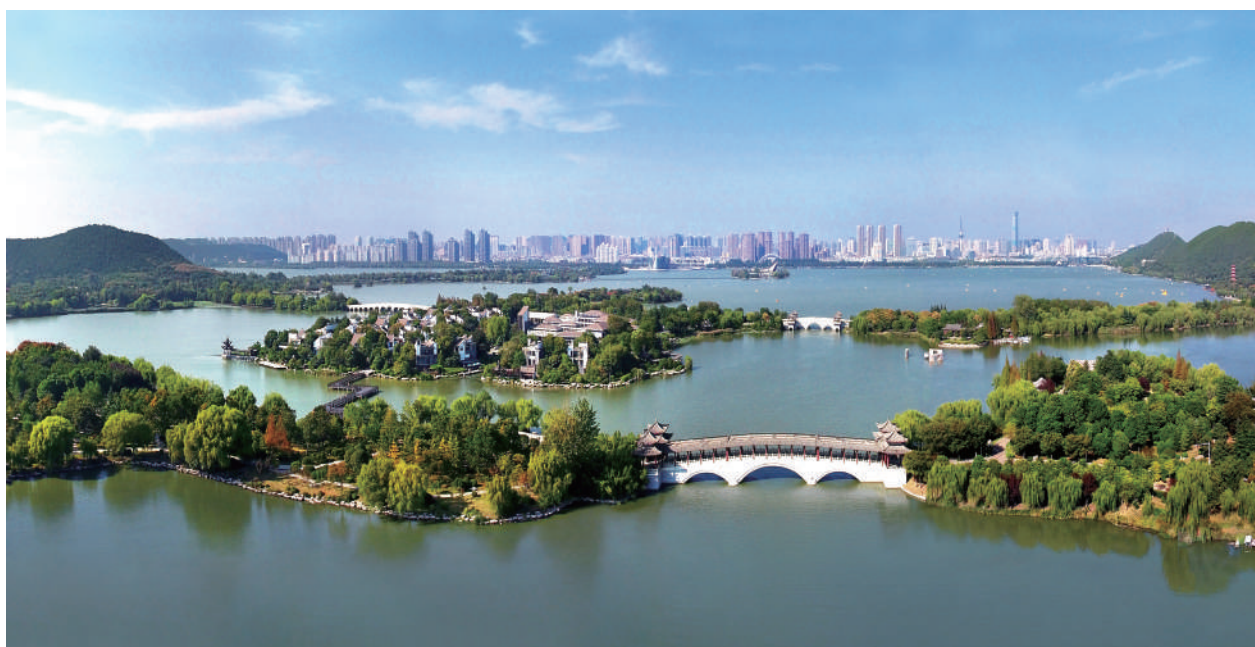
● 徐州云龙湖风景区