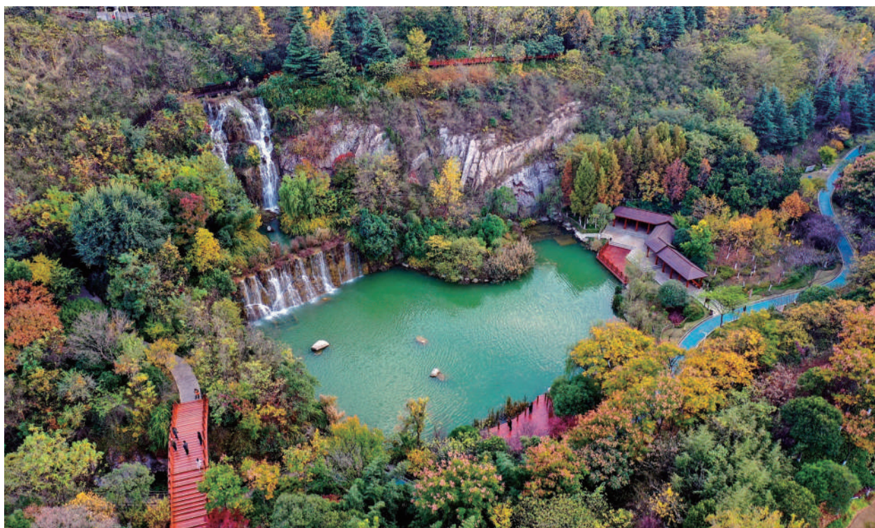
● 徐州金龙湖风景区