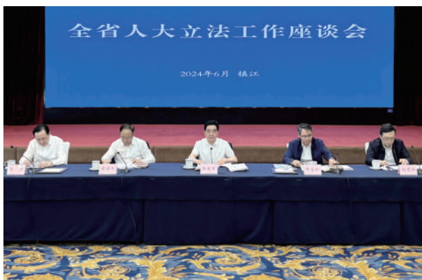
● 6月7日,全省人大立法工作座谈会在镇江召开。省人大常委会副主任、党组书记张爱军出席会议并讲话。