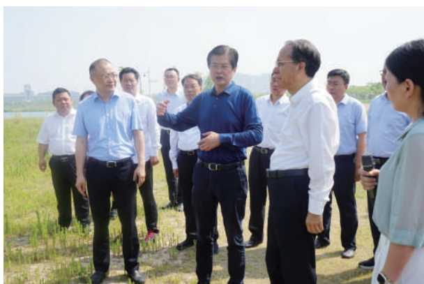
● 6月11日至13日,省人大常委会副主任魏国强率调研组到连云港、淮安,就《江苏省地下水管理条例(草案)》开展立法调研。