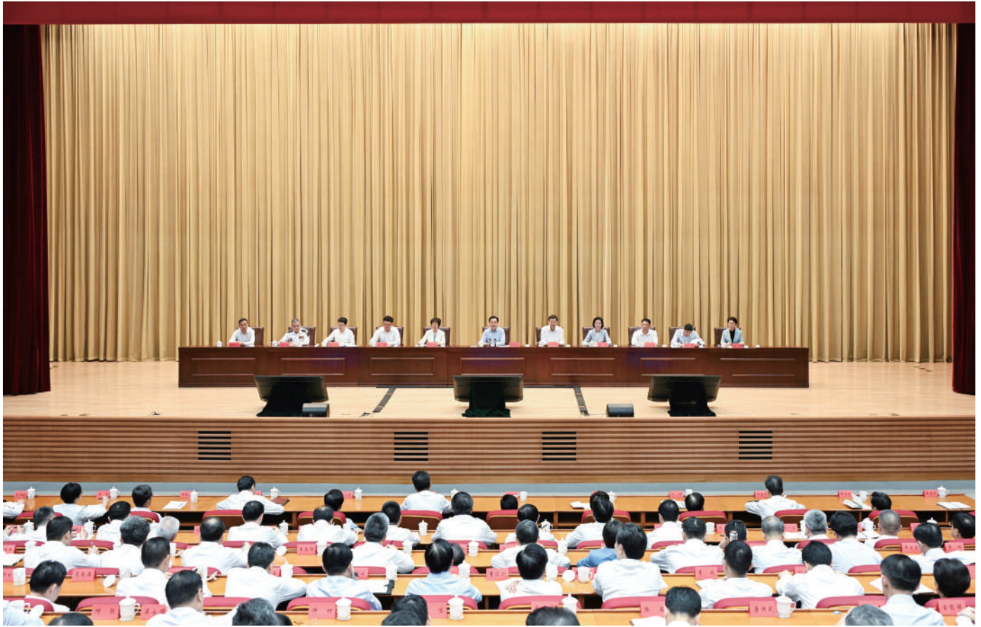
◆ 6月25日,全省警示教育会召开。省委书记、省人大常委会主任信长星主持会议并讲话。