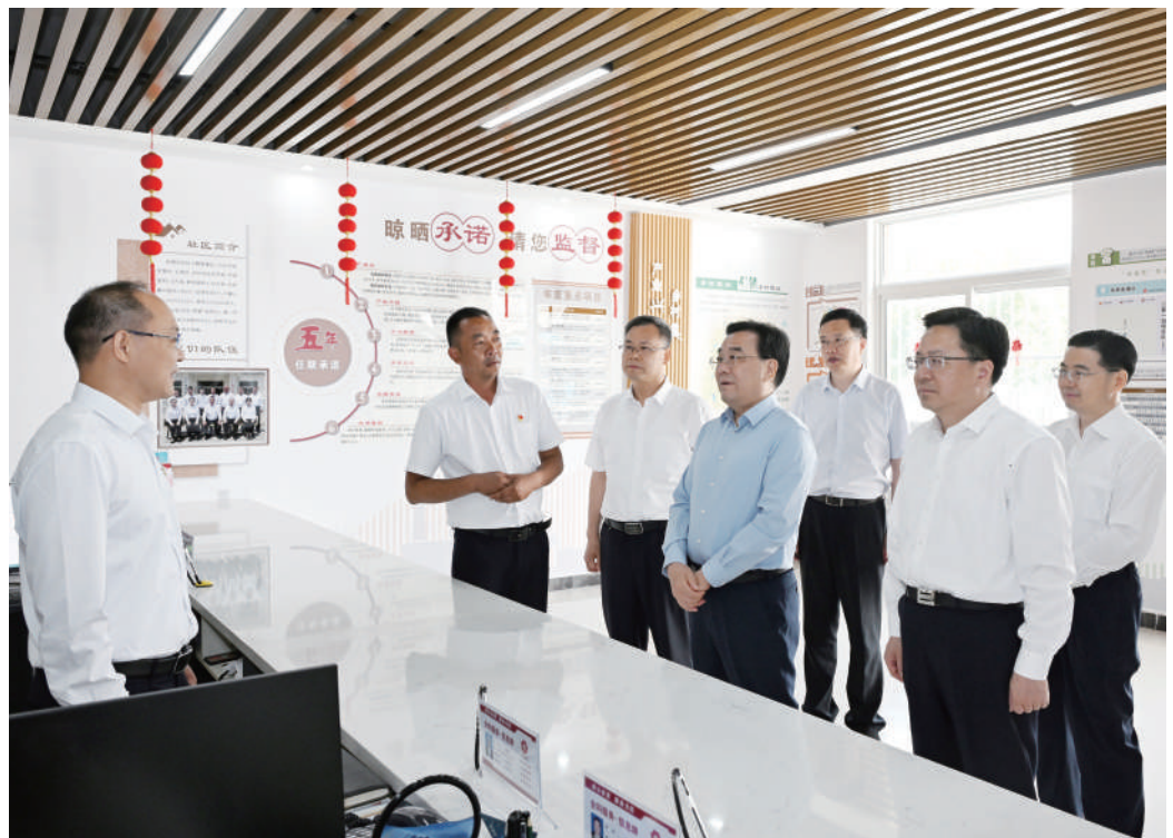
◆ 6月25日至26日,省委书记、省人大常委会主任信长星在宿迁市泗洪县接待信访群众并到乡村振兴联系点调研。