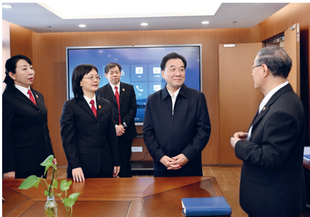
◆ 1月13日,省委书记、省人大常委会主任信长星到省法院、省检察院调研。