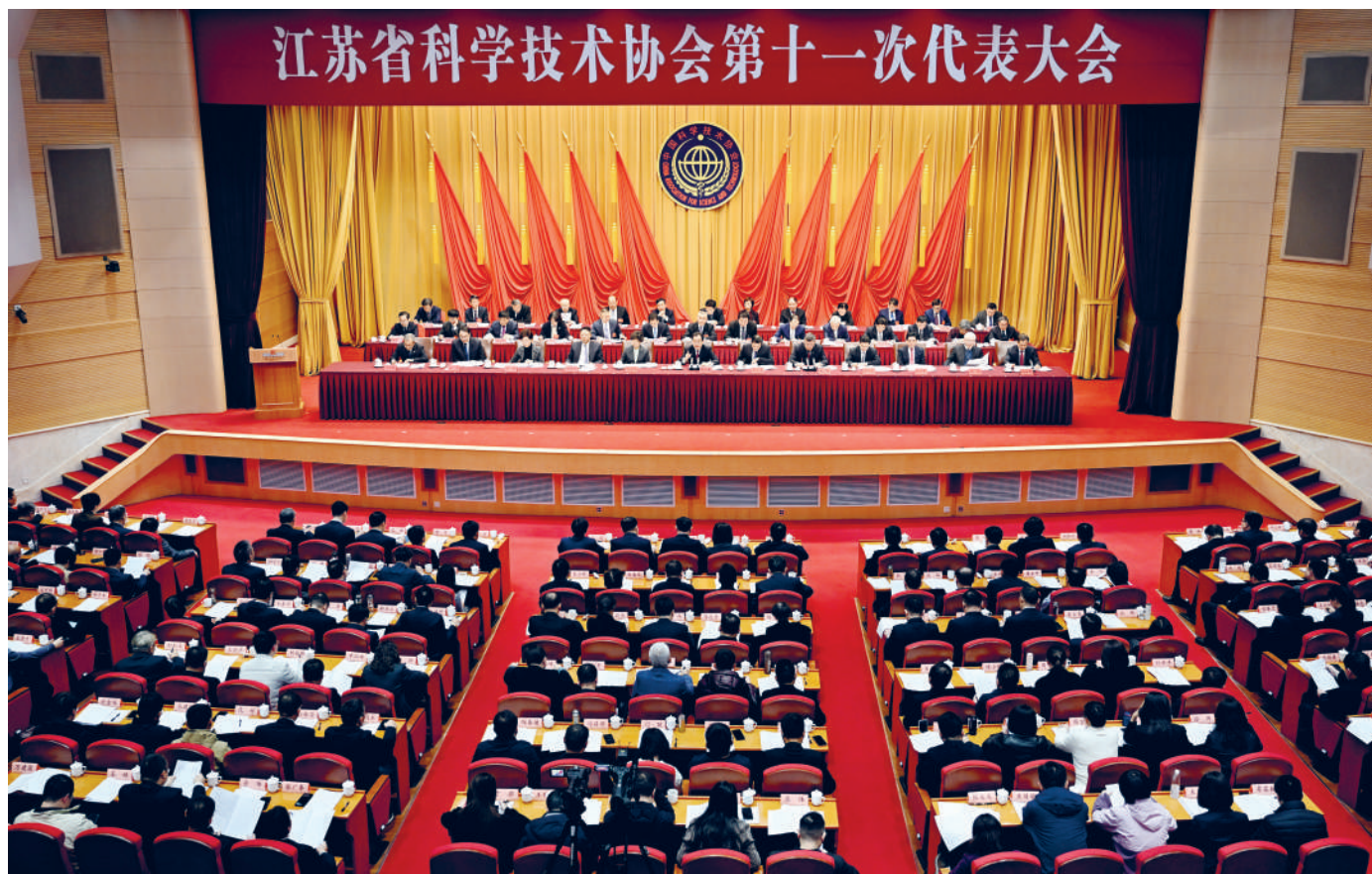
◆ 1月13日,江苏省科学技术协会第十一次代表大会在南京开幕。省委书记、省人大常委会主任信长星出席并讲话。